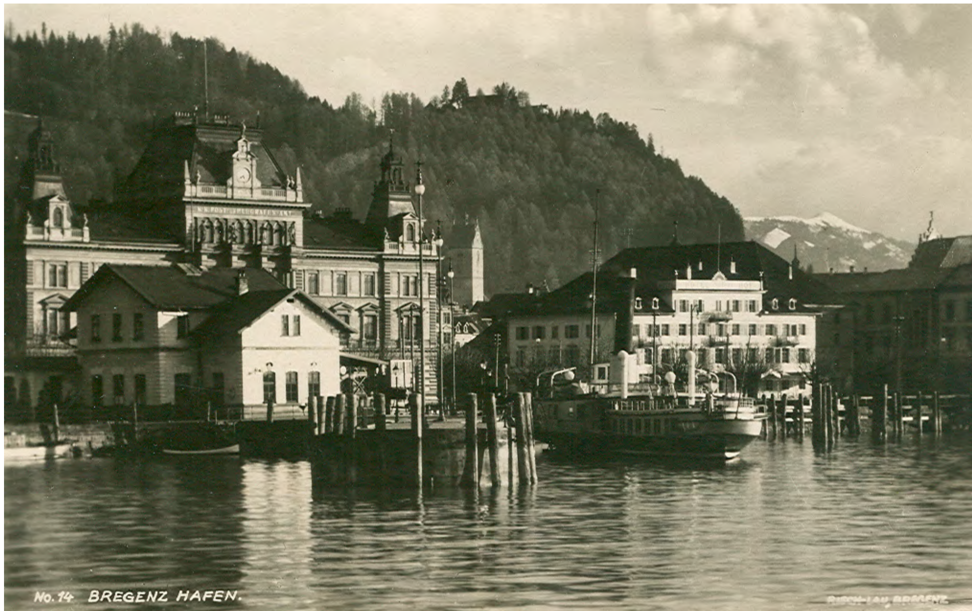
No. 14 BREGENZ HAFEN.