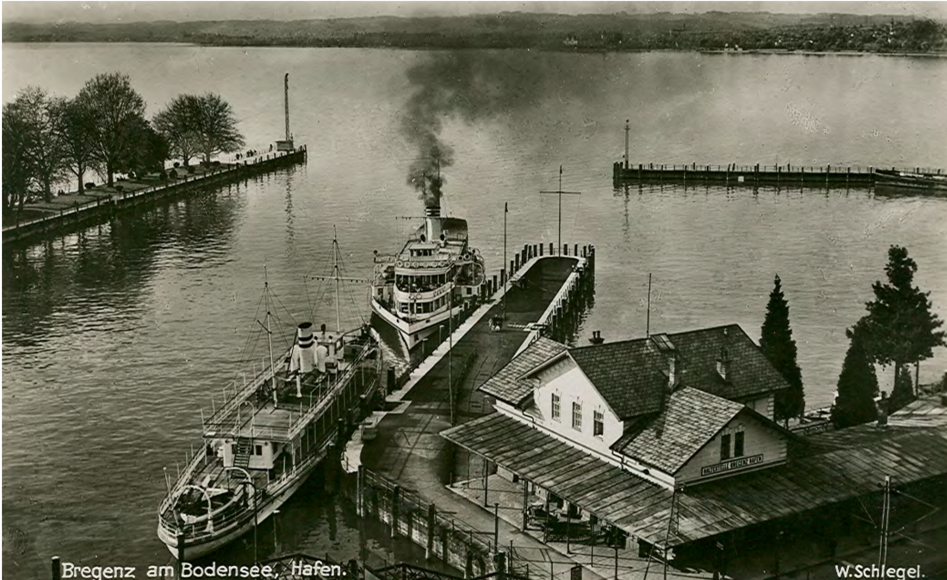
Bregenz am Bodensee, Hafen.