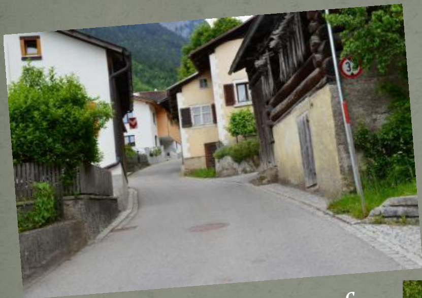
Die Dorfstraße hinauf...